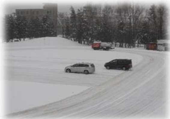
シャーベット状の雪を再び圧雪 12月25日(木)

に作業が進み、昨年度よりも早く、平成三十年一月五日(金)にリンクをオープンすることができました。オープン前日に、安全ネットワークで各家庭に配信連絡させていただきました。以降はご存じのように穏やかに晴れる日が多く、利用人数は少なめではあるものの、スケートの練習に励む子どもたちの姿が毎日見られました。スケートの他にも様々なスポーツ少年団や教育関係機関主催の学びに関わる行事への参加など、冬休み中の体力づくりや家庭学習のリズムづくりに励んだ子どもが多かったことと思います。リンクはすでに維持散水に移り、ベストコンディションが維持されてきました。これから体育授業でも活用され、二月一日(木)・二日(金)・五日(月)に予定されている記録会で、その練習成果を確かめることとなります。