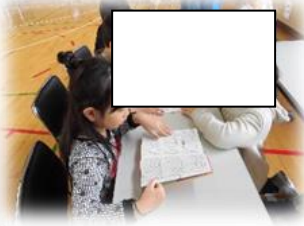
国語辞典の使い方を2年生に教える3年生 総合「おべんきょうランド」から 2日(金) 2・3年生