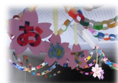
校内も卒業式間近