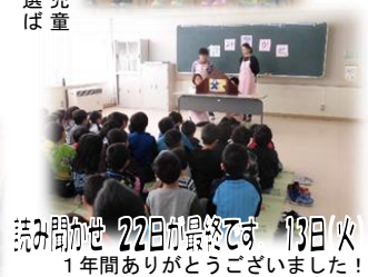
読み聞かせ 22日が最終です 13日(火) 1年間ありがとうございました!