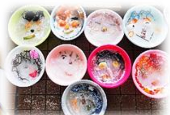
臨休で残念だった1年生の水のお面 いくつかは掲載をと思っていて今日になってしまいました。 2月5日(月)