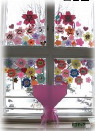
こもれびおわりの会 6日(火)