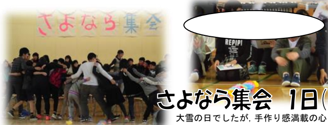
さよなら集会 1日(木)

今週末23日(金)は6年生にとって晴れの卒業の日、在校生には学年修了の日です。16日(金)にあった卒業生単独の証書授与練習のあと、6年1組学級みんなの思いを代表して■■■くん、■■■さんから「いい卒業式にできるように頑張りたい」という力強い言葉を聞きました。思いを形にして表現しようと真面目に取り組もうとする意志に心を動かされました。当日はきっと心に残る卒業式になることでしょう。