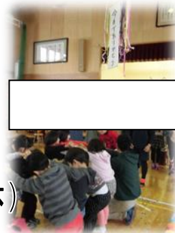
児童会役員選挙 6日(火)