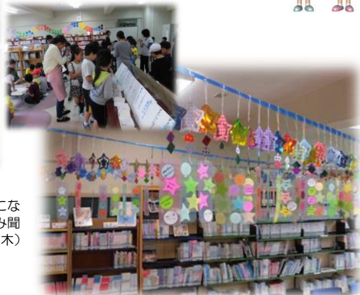
七イベントときれいに飾られた短冊 6月末・7月の2回行われた七イベントで子ども たちが作った願い事の短冊が図書室を彩っています。