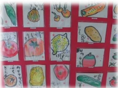
3年生の秀作の一部です

学習に地域の素材・施設・人材などを積極的に取り入れていくことが、2020年度からの新しい小学校学習指導要領ではさらに大切にされています。全ての学年が出かけるバス学習はもちろん、帯小の特色ある活動、地域施設訪問「かけはし交流」や帯広市が行っている「おびひろっ子絆支援事業」はそれにあたります。