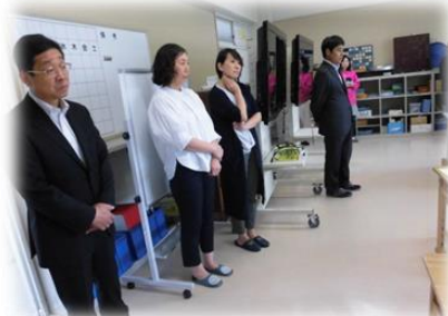
のぞみ学級の授業を参観される 出席された評議員のみなさん

しかず」教育活動の実際にふれていただきました。5名の評議員さんには学校関係者評価にも加わっていただき、地域の目から帯小の教育やその成果としての子もたちについてご意見をいただいたり、評価をしたりしていただくこととなります。今後ともよろしくお願いたします。