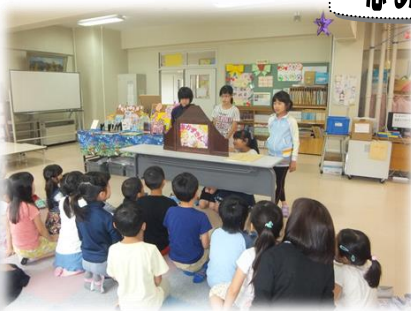
子どもたちも読み聞かせ（図書委員会） 図書ボランティア「さくらんぼクラブ」の方達にな らぬ、図書委員会の子もたちが休み時間に読み聞 かせを行いました。とても上手でした。12日（木）