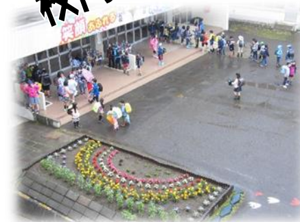
ある日の朝（玄関開錠前） 不純な天候が続いていますが子どもたちは元気で す。玄関前に列を作っています。 花壇はボランティアの方のデザイン